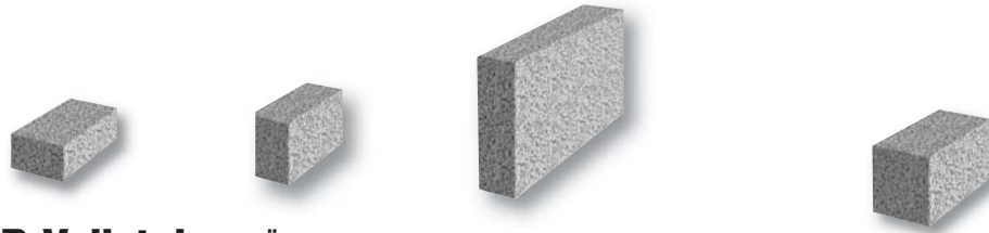
KLB-Vollsteine ÜZ WB 1-2005/0510